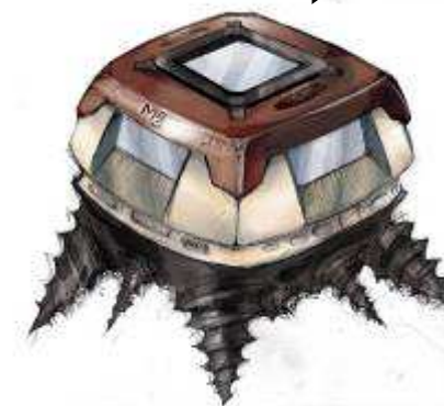
Le prototype du Magma Explorer